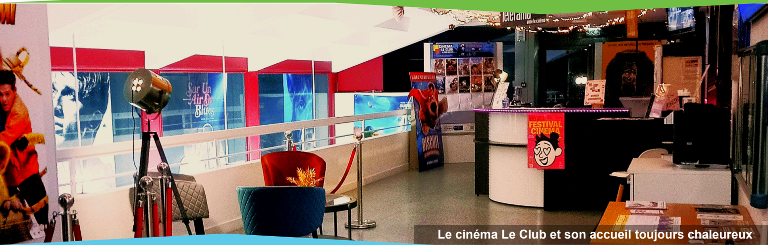
Le cinéma Le Club et son accueil toujours chaleureux

La communication de la municipalité vers l'ensemble des foyers de la commune a revêtu moult habits durant le mandat qui s'achève :