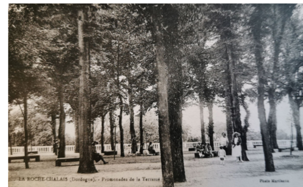
LA ROCHE-CHALAIS, Promenade de la Terrasse en 1910