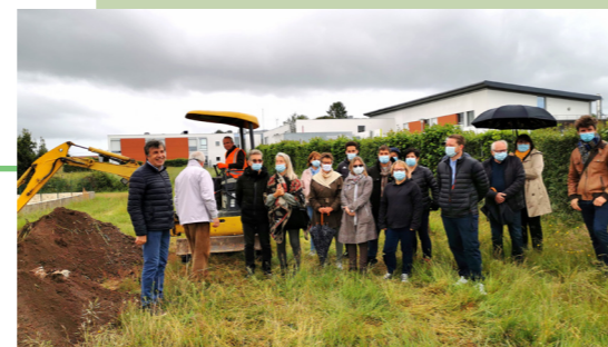
Parc du Vallon de Charmot : Début du chantier le 17/05/21