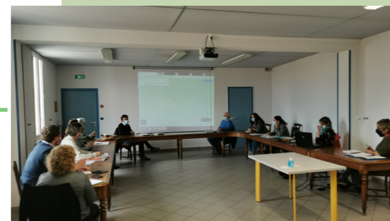
Revitalisation du centre-bourg en cours - Réunion avec le CAUE 24 du 04/05/21