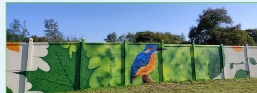
Entre la nature et les espaces publics, le Street Art pose ses ailes à St Michel-de-Rivière