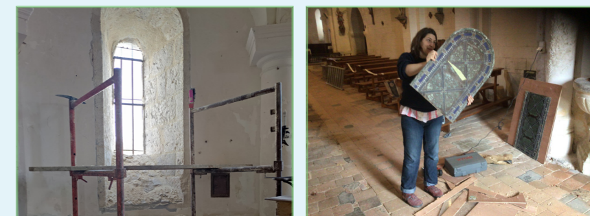
Rénovation des fenêtres de l'Eglise à St Michel Léparon

Cette réalisation se veut nature et sobre pour une harmonisation totale des différents espaces et projets à venir.