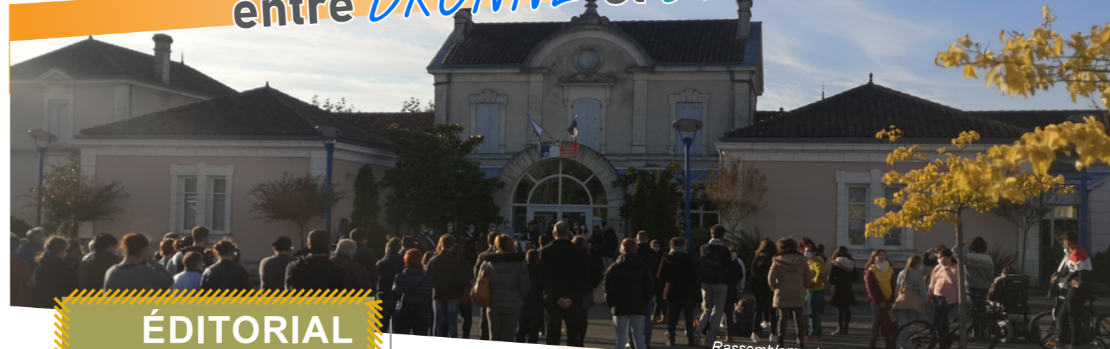
Rassemblement - Hommage à Samuel PATY - 19/10/2020