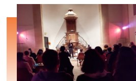
Festival Contez les feuilles, au Temple

Cette année la commission Culture a lancé l'automne culturel du 1er au 31 octobre 2020, un Automne Culturel élargi pour la première fois à toutes les structures et organisations de la commune : médiathèque, cinéma, associations... afin de respecter au mieux les objectifs du Projet Culturel Communal élaboré en juillet dernier. Durant cette période, ce sont donc de nombreuses actions et animations culturelles qui se sont déroulées dans notre commune :