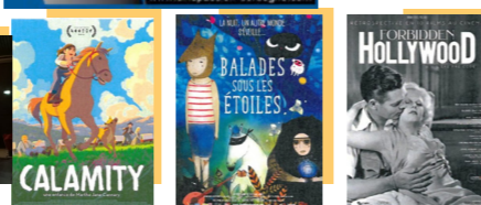
Ciné Mémoire, Anime et ateliers pour l'Automne Culturel

Cinéma - Le Club, La Roche Chalais Retrouvez les sorties du mois de novembre 2020